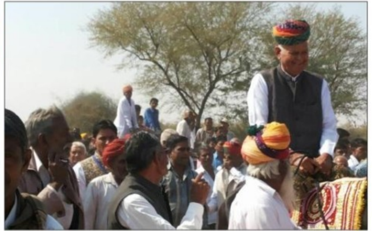
माली युवा संघ मुम्बई के द्वितीय स्नेह मिलन की झलकियां