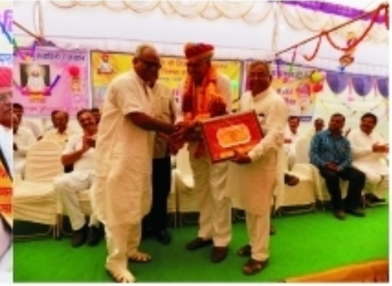
केन्द्रीय मंत्री सी. आर. चौधरी का स्वागत