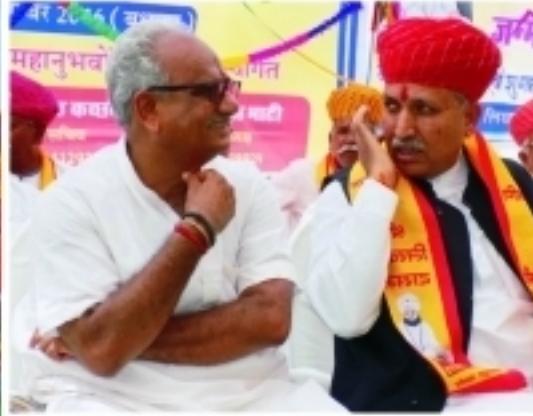
केन्द्रीय मंत्री अर्जुनराम मेघवाल एवं अतिथिगण