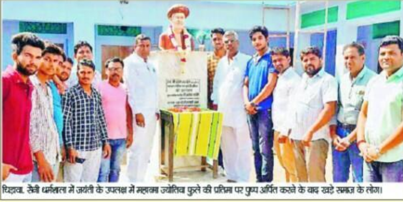
विद्यार्थी सैनी धर्मशाला में जयंती के उपलक्ष्य में महात्मा ज्योतिबा फूले की प्रतिमा पर पुण्य अर्पित करने के बाद खड़े समाज के लोग।