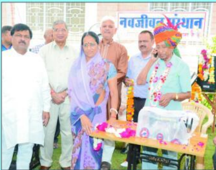
जरूरत मंद महिलाओं को सिलाई मशीन प्रदान कते अतिथिगण