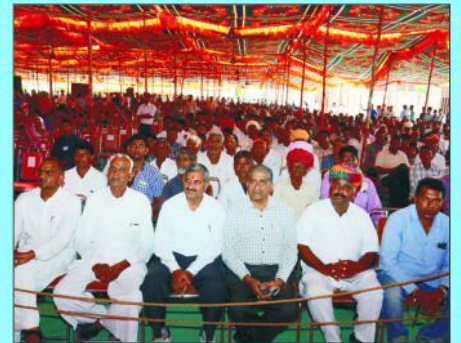
समारोह में उपस्थित समाज बंधु