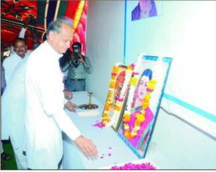
श्री अशोक गहलोत माल्यार्पण करते हुए