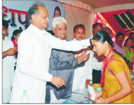
श्री अशोक गहलोत प्रतिभावान छात्रा को आशिर्वाद देते हुए