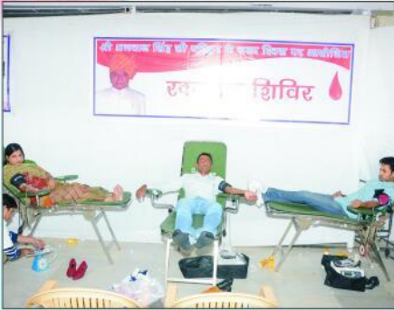
रक्तदान करते हुए युवक-युवतियां