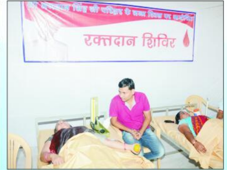
रक्तदान करती हुई महिलाएं