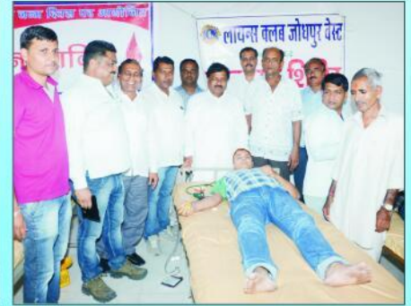
जोधपुर भवन हरिद्वार के समस्त पदाधिकारी, कार्यकारिणी सदस्य एवं अन्य रक्तदाता का उत्साह वर्धन करते हुए