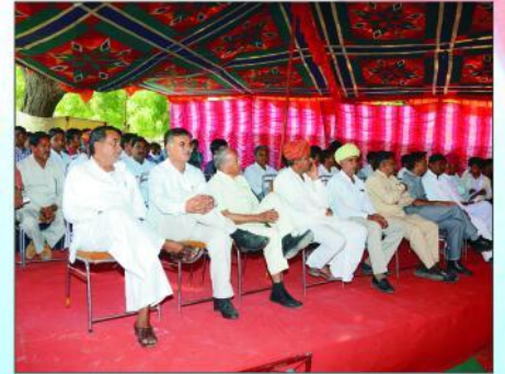
मंच पर उपस्थित समाज के गणमान्य समाजबंधु